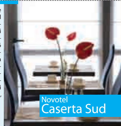
Novotel Caserta Sud

L'hotel è situato nell'area business a nord est di Milano, a pochi minuti dal teatro degli Arcimboldi. Ben collegato con il centro, è a 3 km dalle uscite autostradali sulla direttrice per Monza. Le 134 camere sono state ristrutturate secondo un progetto stilistico attuale ed equilibrato con arredi lineari e contemporanei. Ristorante con sorprendente effetto scenico, 7 sale meeting modulari, fitness room.