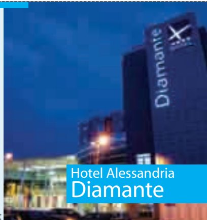
Hotel Alessandria Diamante

Alessandria 0131.611111 www.hoteldiamantealessandria.it