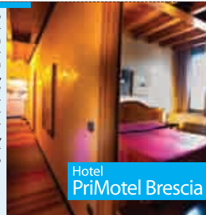
Hotel PriMotel Brescia

Brescia 030.3534286 www.primotelbrescia.it